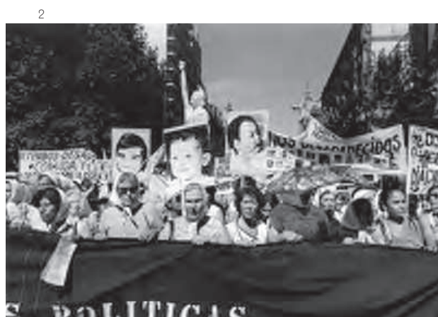
fig. 1. Silvio Zuccheri, fotografías de desaparecidos en pancartas. Buenos Aires, 1983.