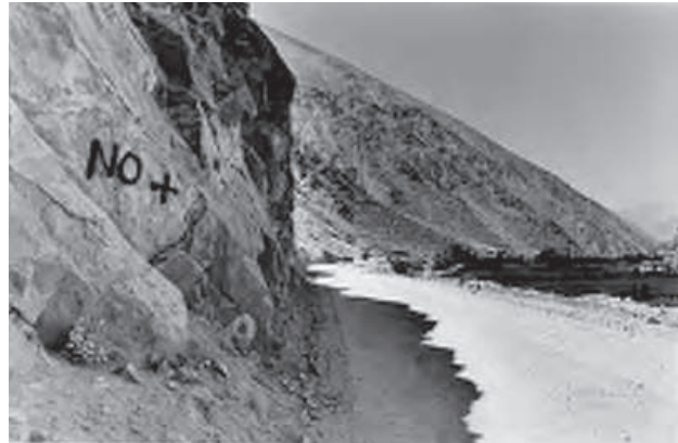
figs. 10-12. CADA, NO+, Santiago de Chile, 1983-1989.