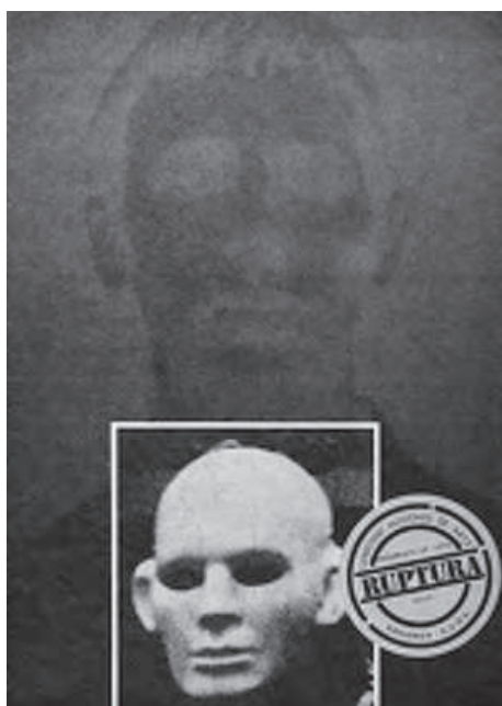
fig. 13. Portada del diario Ruptura , Santiago de Chile, 1982.

10. Si el activismo artístico logra abolir la distancia objeto-sujeto es, ni más ni menos, porque exige “poner el cuerpo” en la práctica.